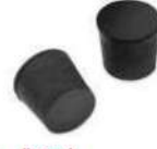
زطمة : Cap

stops the tube from moving and seals holes in formwork and moulds