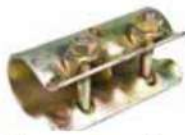
Sleeve Coupler مربط وصلة