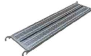
1800 mm X42 mm