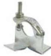
Board Retaining Clamp مربط خشب