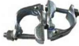
Swivel Coupler مربط متحرك