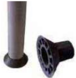
مواسير : Tube

Provides protection for through-ties on wall and beam formwork