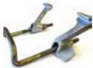
H20 Flange Clamp مربط خشب