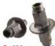
Type B : 520 gram/120 kn Type C :540 gram/180 kn