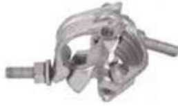
Double Coupler مربط ثابت