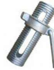
Threaded Sleeve With Nut