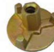
3-Wings 700 gram / 100Kn