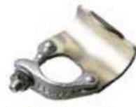
Putlog Coupler مربط كف