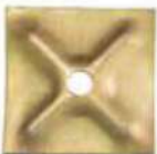
Thickness : 4mm , 5mm 6mm , 8mm & 10mm 12cm x 12cm