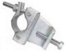
Girder Coupler مربط جسر