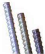
Type A :110Kn/ Type B 130Kn Type C 160kn 15/17 mm Weight 1.47Kg/m